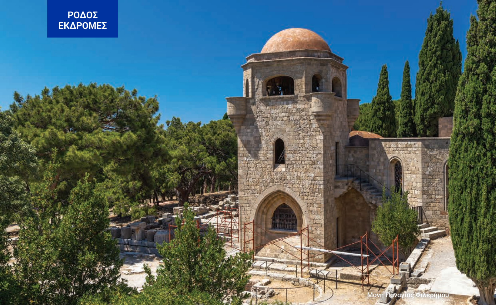
Μονή Παναγίας Φιλερήμου