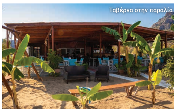
Ταβέρνα στην παραλία