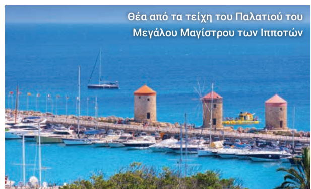
Θέα από τα τείχη του Παλατιού του Μεγάλου Μαγίστρου των Ιπποτών

Η ξενάγησή μας περιλαμβάνει επίσης το Τζαμί του Σουλεϊμάν του Μεγαλοπρεπούς, τα τούρκικα λουτρά, το Νοσοκομείο των Ιπποτών και την Εκκλησία της Παναγίας του Κάστρου, που στέκεται εκεί από τον 11ο αιώνα.