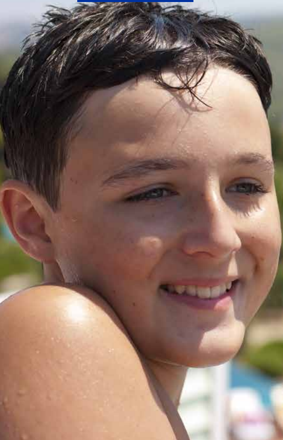
Adaland Water Park