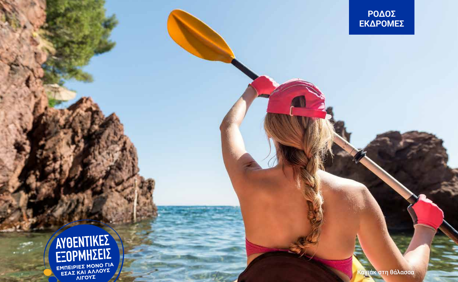
Καγιάκ στη θάλασσα