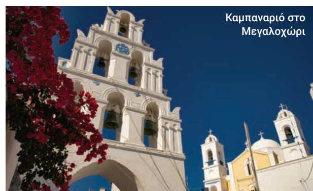
Καμπαναριό στο Μεγαλοχώρι