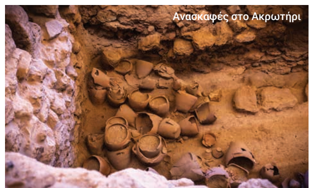
Ανασκαφές στο Ακρωτήρι

Η ξενάγηση ενδέχεται να μην είναι διαθέσιμη ορισμένες περιόδους του χρόνου.