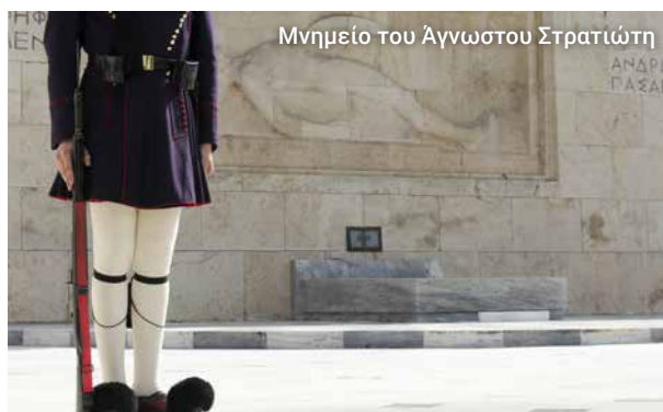
Μνημείο του Άγνωστου Στρατιώτη