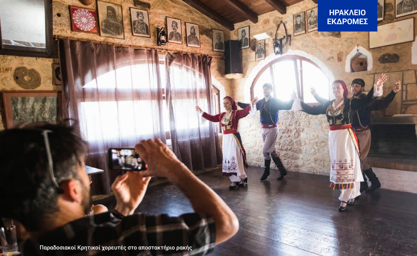
Παραδοσιακοί Κρητικοί χορευτές στο αποστακτήριο ρακής