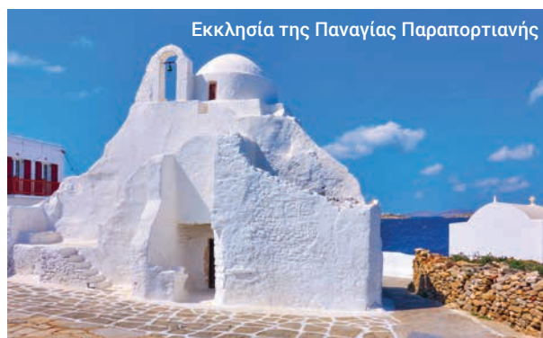
Εκκλησία της Παναγίας Παραπορτιανής