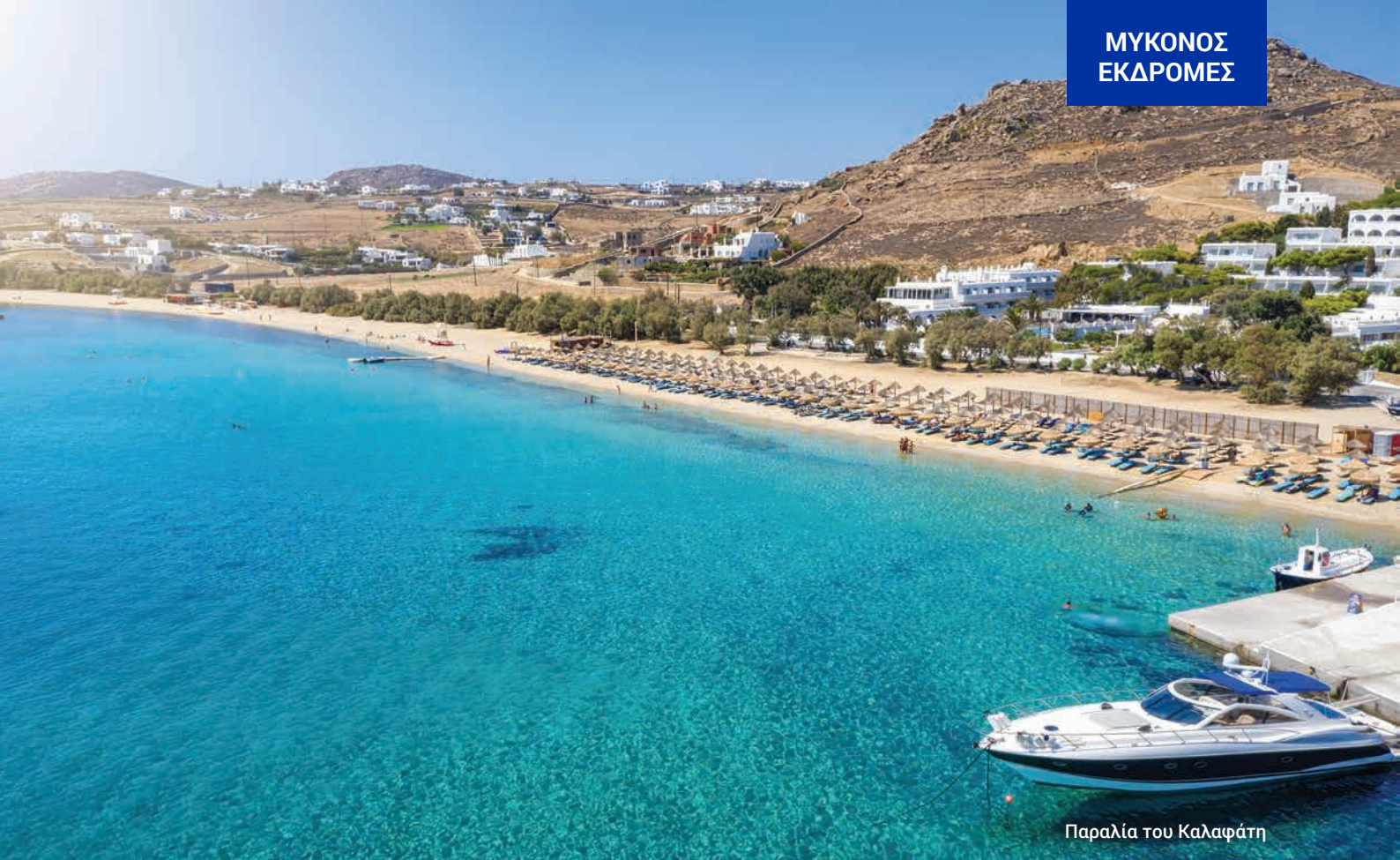
Παραλία του Καλαφάτη