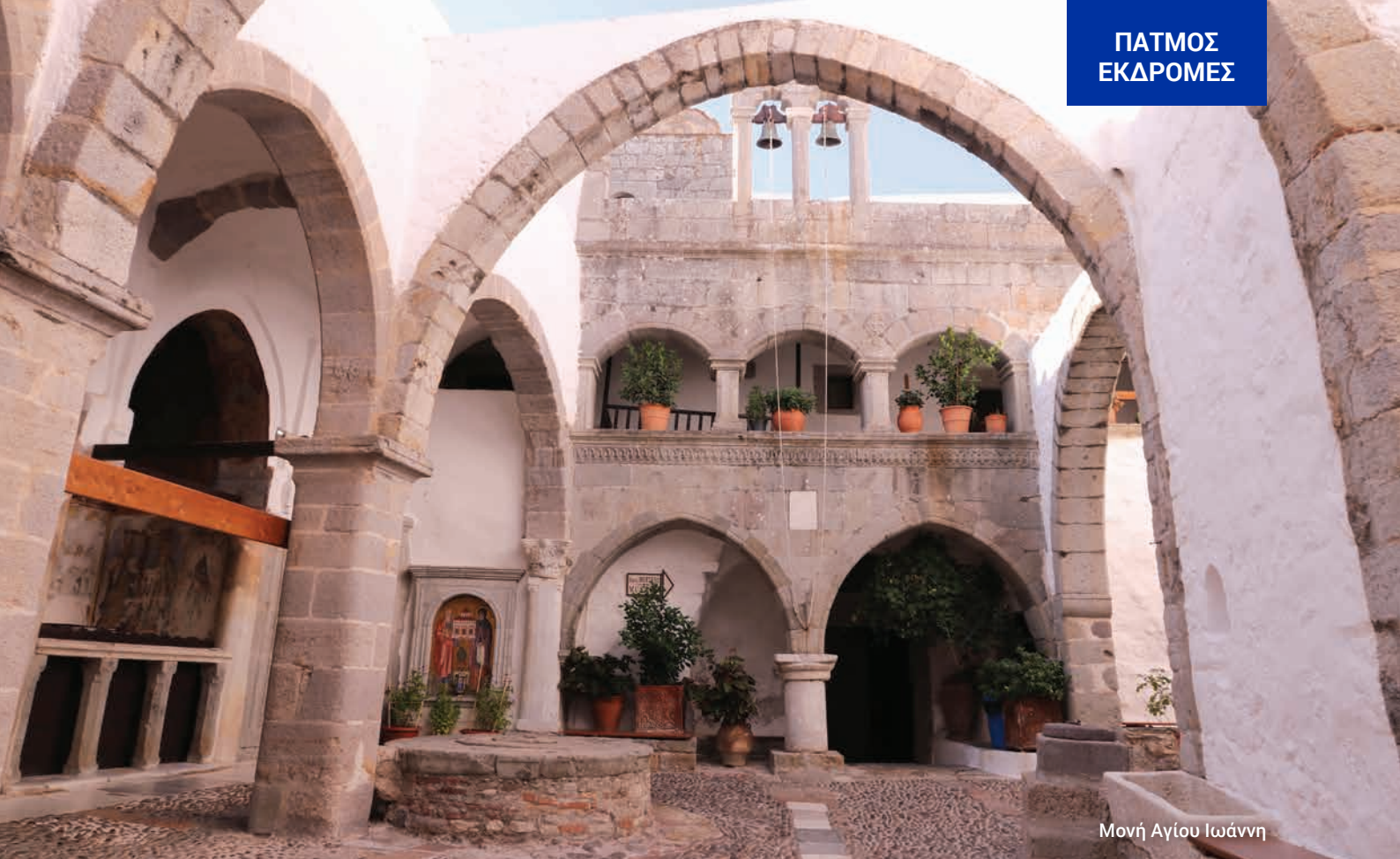
Μονή Αγίου Ιωάννη