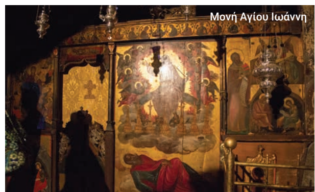
Μονή Αγίου Ιωάννη

Στην ελληνική μυθολογία, η Πάτμος βρισκόταν αρχικά στον βυθό της θάλασσας, αλλά ο Δίας πείστηκε να την αφήσει να αναδυθεί μέσα από το νερό. Ο ήλιος στέγνωσε τη γη και άνθρωποι από τις γύρω περιοχές άρχισαν να κατοικούν στο νησί που ονόμασαν Λητώς, από τη θεά Αρτέμιδα.