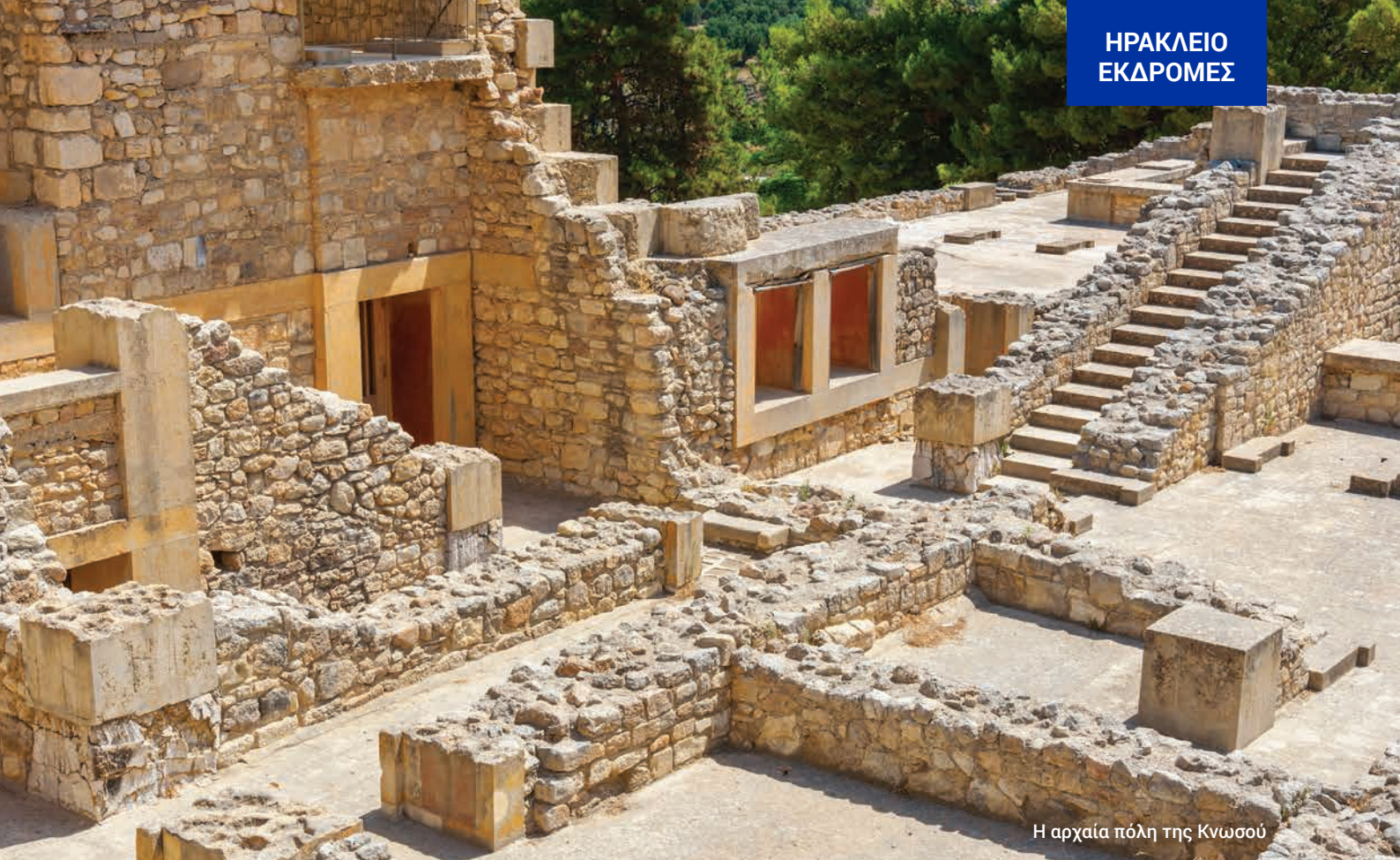
Η αρχαία πόλη της Κνωσού