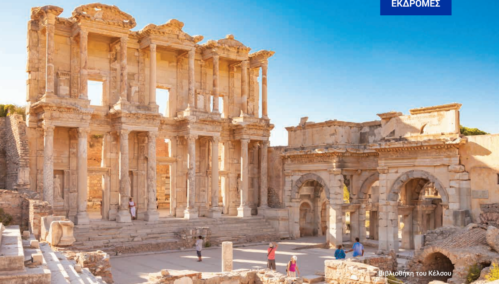
Βιβλιοθήκη του Κέλσου