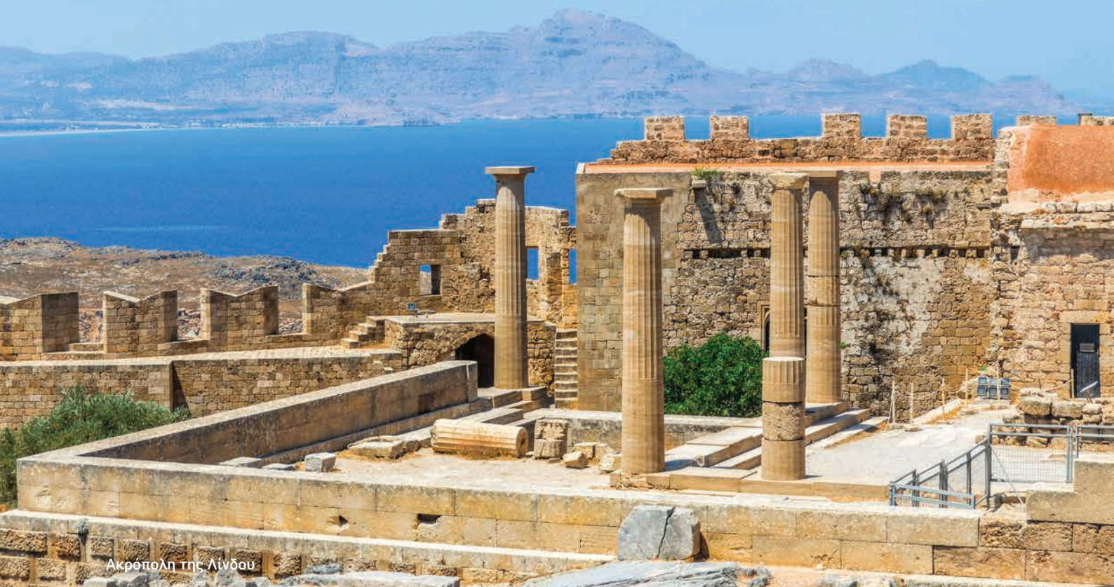
Ακρόπολη της Λίνδου