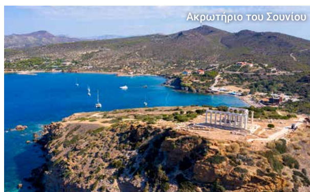
Ακρωτήριο του Σουνίου

Ο αρχαιολογικός χώρος του Σουνίου, εκτός από τα Ιερά του Ποσειδώνα και της Αθηνάς, περιλαμβάνει το φρούριο, έναν μικρό οικισμό της ελληνιστικής εποχής, τα προπύλαια και τις στοές.