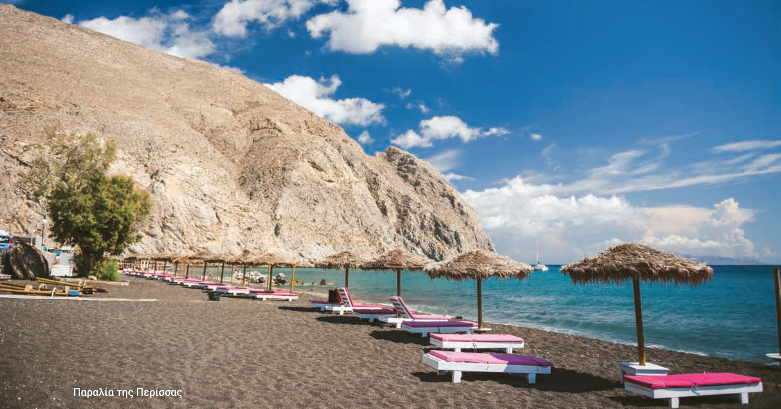
Παραλία της Περίσσης