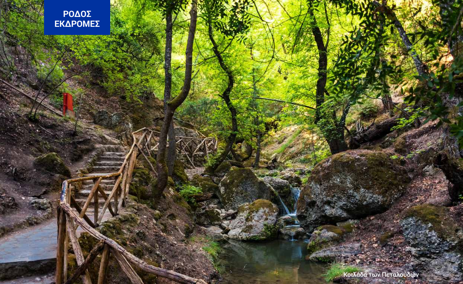
Κοιλάδα των Πεταλούδων