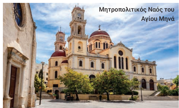
Μητροπολιτικός Ναός του Αγίου Μηνά