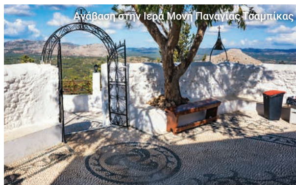
Ανάβαση στην Ιερά Μονή Παναγίας Τσαμπίκας