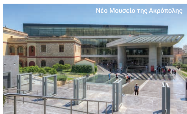
Νέο Μουσείο της Ακρόπολης

Στο τέλος της διαδρομής μας, ελπίζουμε να έχετε γνωρίσει καλά τα μεγαλειώδη μνημεία της κλασικής Αθήνας και να έχετε διαμορφώσει μια καλύτερη ιδέα για μία από τις πιο ιστορικά σημαντικές πρωτεύουσες στον κόσμο.