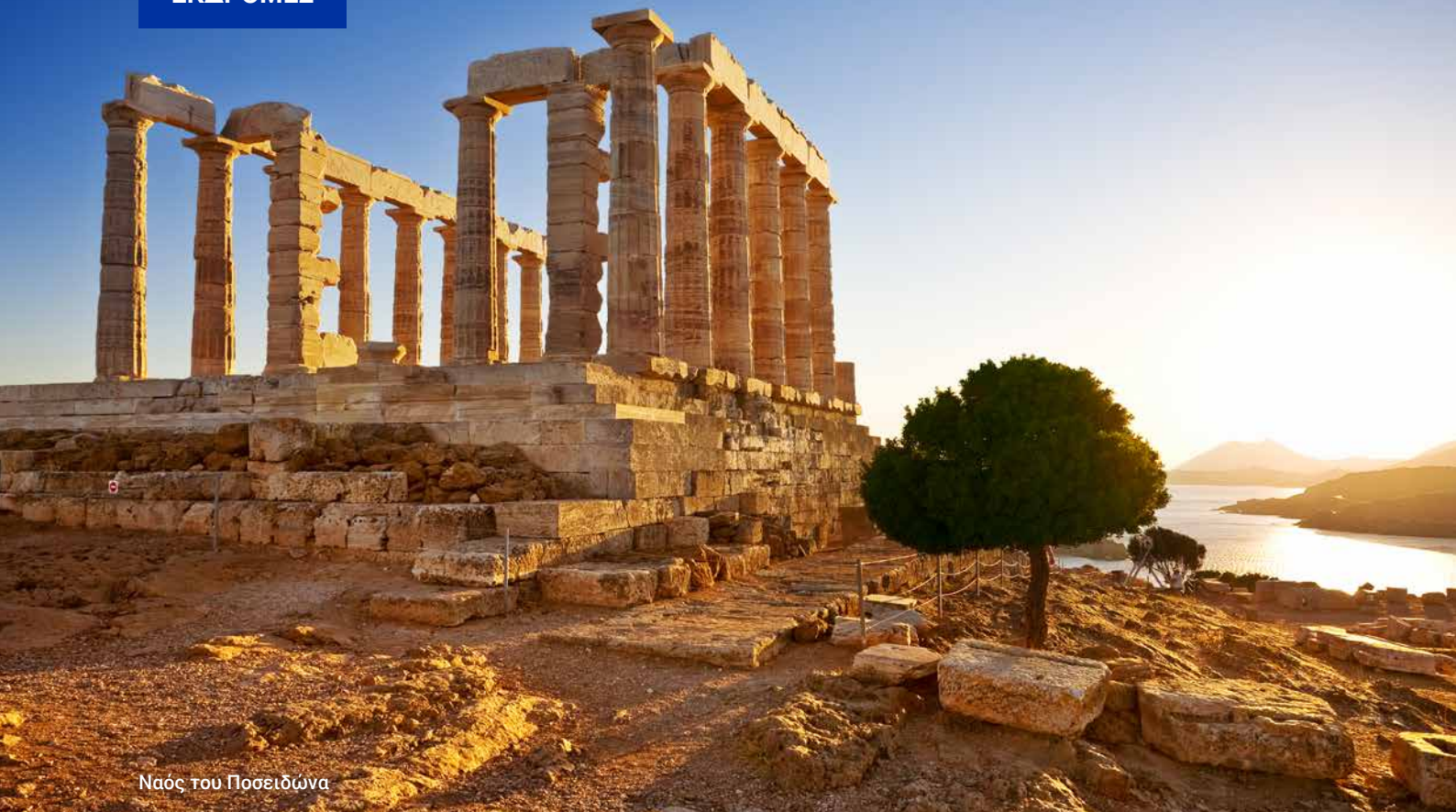
Ναός του Ποσειδώνα