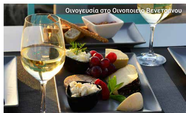
Οινογευσία στο Οινοποιείο Βενετσάνου

Στην πρωτεύουσα Φηρά θα υπάρχει ελεύθερος χρόνος για να κάνετε αγορές και να εξερευνήσετε μόνοι σας πριν επιστρέψετε στο πλοίο έχοντας υπέροχες εικόνες στο μυαλό σας και ίσως στη φωτογραφική μηχανή.