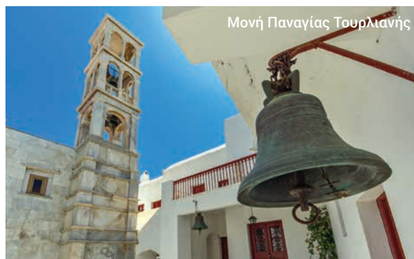
Μονή Παναγίας Τουρλιανής

Η ξενάγηση ενδέχεται να μην είναι διαθέσιμη σε ορισμένες περιόδους του χρόνου.