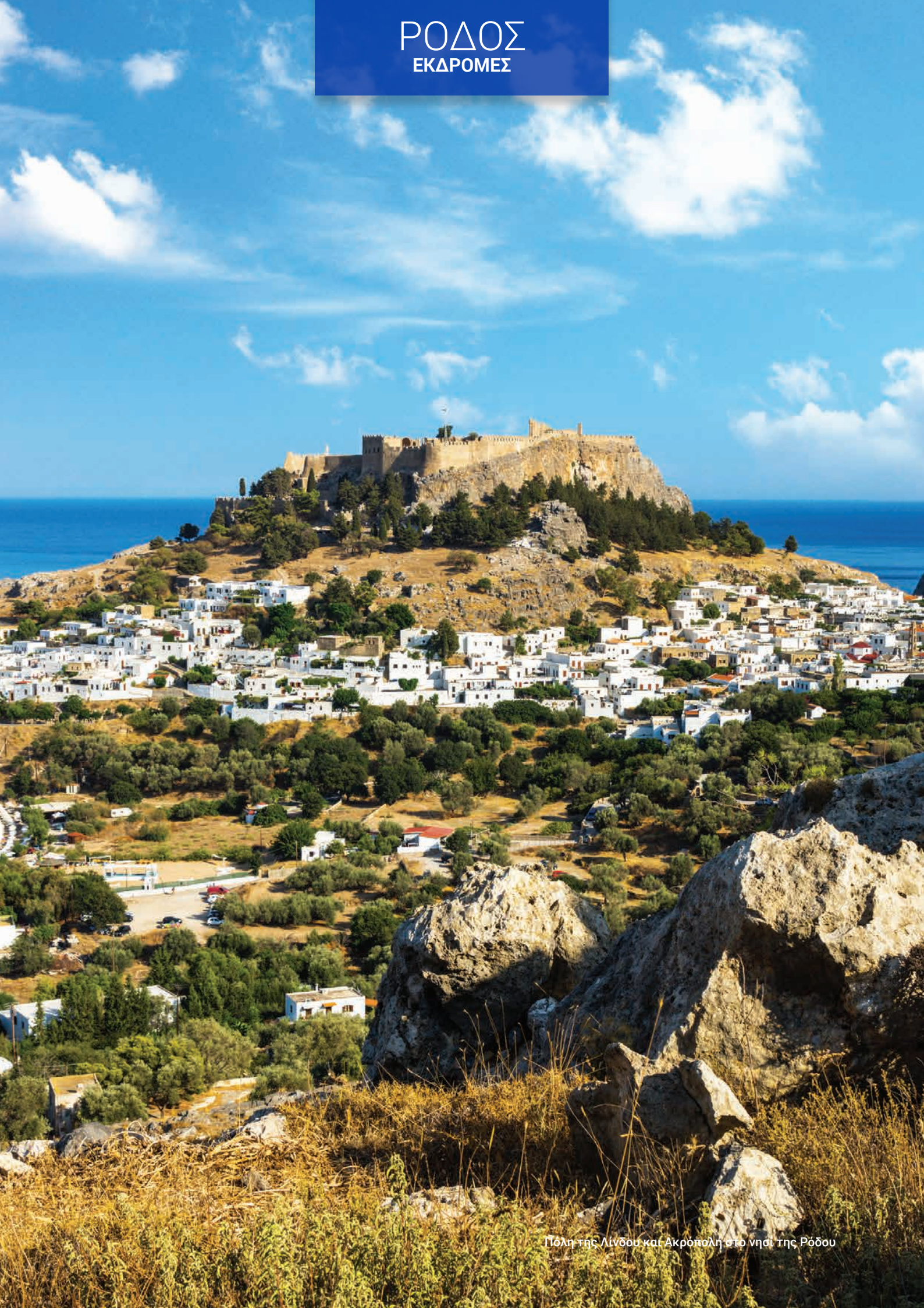
Πόλη της Λίνδου και Ακρόπολη στο νησί της Ρόδου