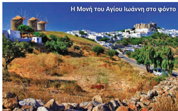
Η Μονή του Αγίου Ιωάννη στο φόντο

Στο ατμοσφαιρικό καφέ Αγίον σας περιμένει καφές και άλλα αναψυκτικά.