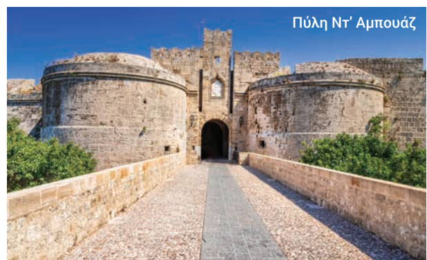
Πύλη Ντ' Αμπούζ

Όπως και να έχει, αυτή η ξενάγηση μας μεταφέρει στην καρδιά της συναρπαστικής ιστορίας της Ρόδου.