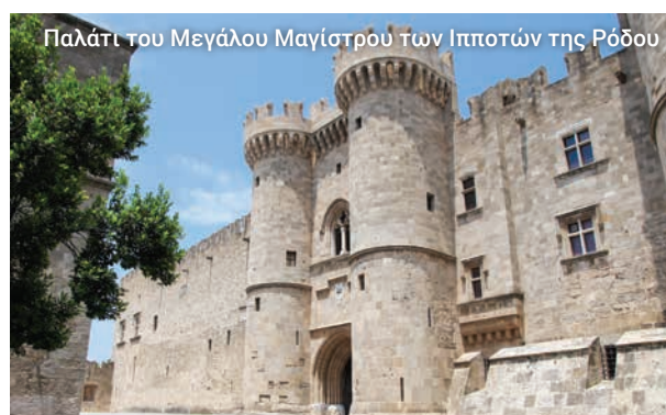
Παλάτι του Μεγάλου Μαγίστρου των Ιπποτών της Ρόδου

Πρόκειται για μία από τις πιο ατμοσφαιρικές και ενδιαφέρουσες περιοχές της Ρόδου, όπου εμβαθύνουμε στην καρδιά και την ψυχή της ιστορίας της.