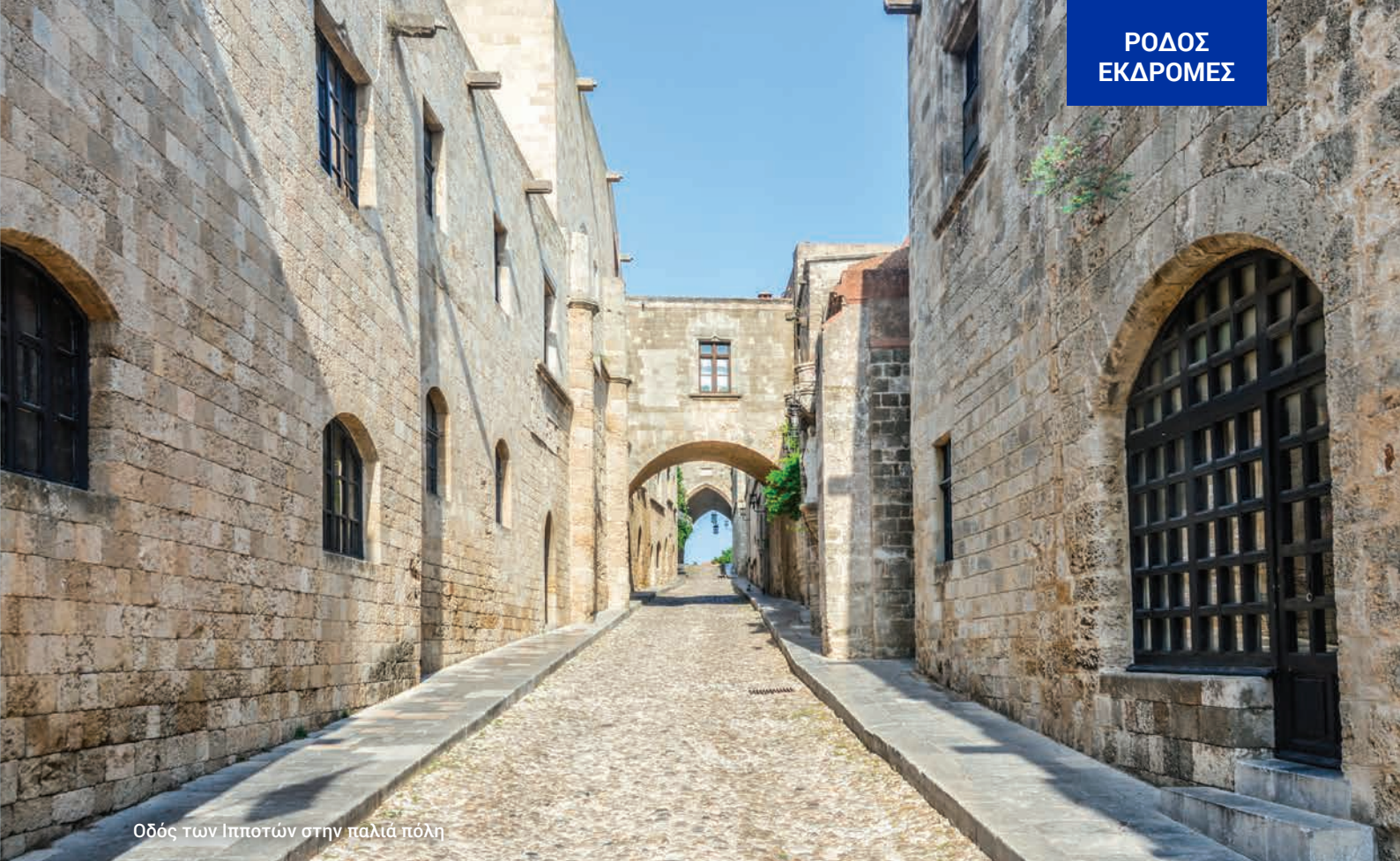
Οδός των Ιπποτών στην παλιά πόλη